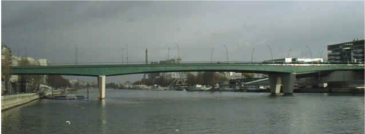
Pont de Garigliano, Paris