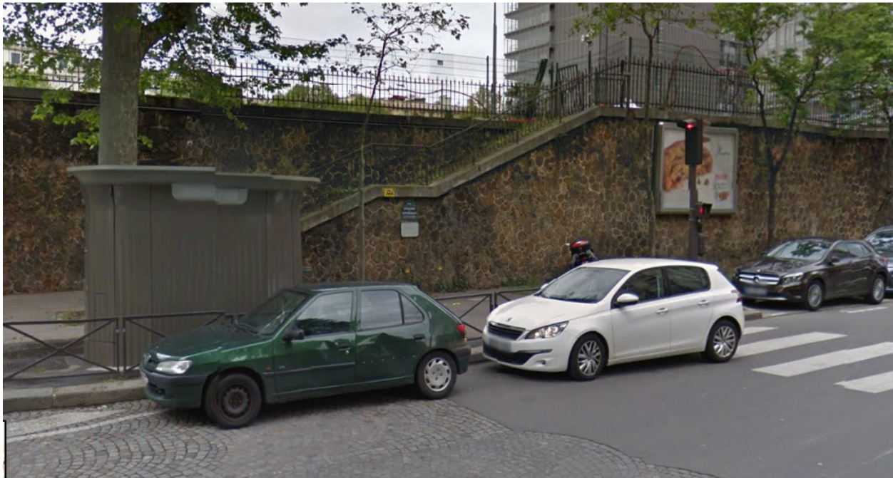
Rechtsseitige Umgebung: Rue Poussin, Paris (2016)