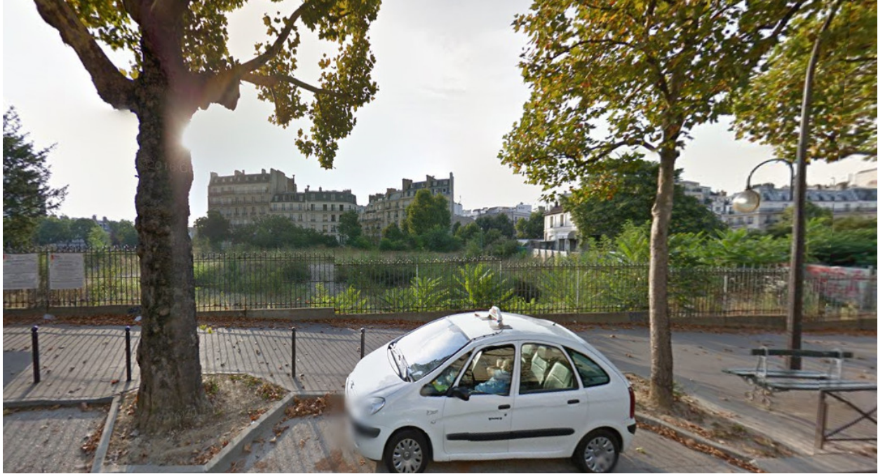
Linksseitige Umgebung: Boulevard Suchet, Paris (2012)