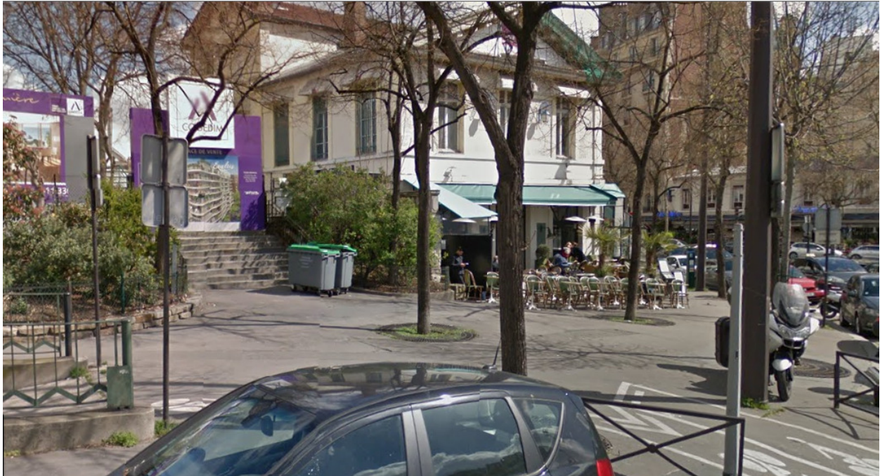
Rest. Auteuil, Rue Poussin (2016)